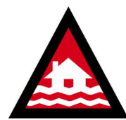
Thönë Nhom de kë Teem Rot

Tiñ Vic Emergency App du ku piëñjë në kängë kä teem rot caal cit yik, ABC Local 91.1FM, Gold 1071AM ku 98.3FM, Hit 91.9FM, Triple M 93.FM, KLFM 96.5FM ku 106.3FM ku muökë thönë nhiim nyiin.