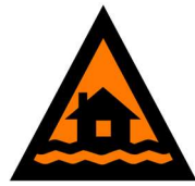
Tiñ ku Loi

Kën nyooth kënë ëye alëu bi looi kubï lëk yiin ye nen bii yäla aboor në yëladu yic dhuk piny, ku ye rëëc dhuök piny.