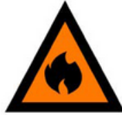
نگاه کنید و عمل کنید

زمانیکه شما این اخطار را متوجه میشوید، به معنای اینست که خطر احتمالی به زندگی و خانه ها وجود دارد. نظر به پروگرام یا پلان تان عمل کنید و بیاد داشته باشید که زود ترک کردن همیشه انتخاب امن تر هست. از خطر دور شده و در یک جای امن تر مثل، خانه دوست خود بروید. اگر دریوری می کنید، چراغ ها را روشن کنید.